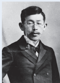
保岡勝也

市制施行90周年を記念した企画展。明治期に東京丸の内ビル街を築いた保岡勝也は、県内では国の登録有形文化財登録第1号で、現在の埼玉りそな銀行川越支店である旧第八十五銀行本店や、庭園が県内初の国の登録記念物である旧山崎家別邸、現在歯科医院として使用されている旧山吉デパートも手がけた建築家です。彼が設計した川越の建築を中心に、当時の写真などからその生涯を追います。