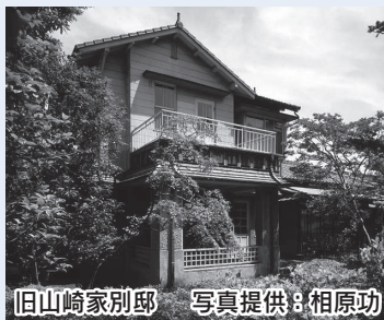
旧山崎家別邸