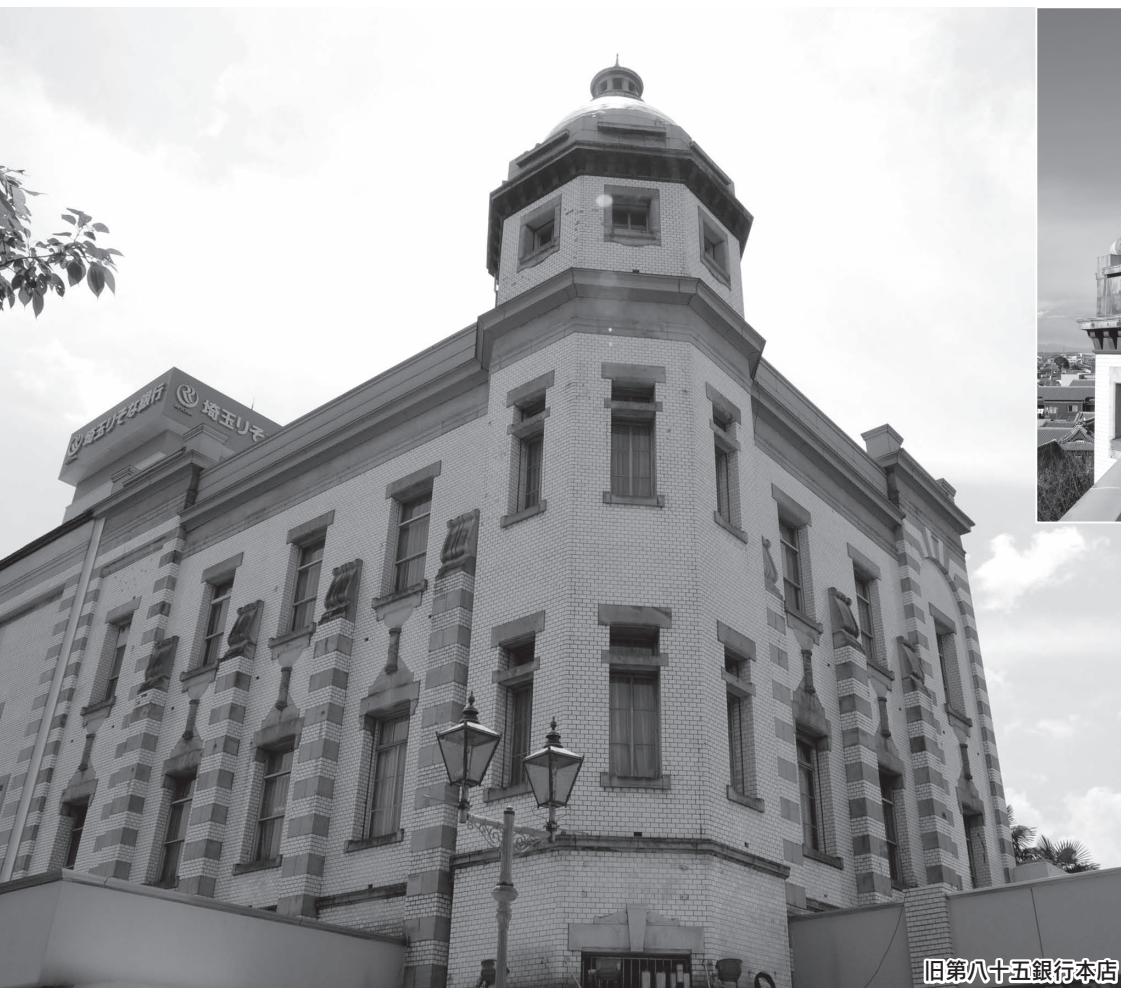
旧第八十五銀行本店