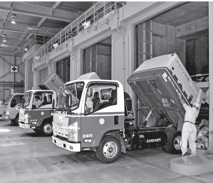
搬入したごみをピットに落とすごみ収集車(上写真)と資源化センターのごみピット(右写真) 家庭から出る可燃ごみ(収集日1日当たり)は、市全体でおよそ300t、約150台のごみ収集車で運びます