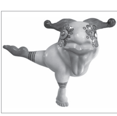
いしばしめぐみ 「Flying Socks」

市立美術館 ☎228-8080 ☎228-7870 午前9時～午後5時(入場は午後4時30分まで) 8月の休館日＝月曜日