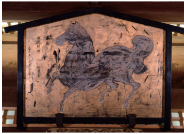
黒馬図大絵馬 川越氷川神社蔵 大きさは縦92cm、横134cm。普段は同神社拝殿内に掲げられています。