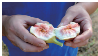
中にあるたくさんのつぶつぶ。一つひとつが、いちじくの花。

「無花果」と名付けられたのは、実の中に花が咲き、そのまま大きくなるので花を外側から見る