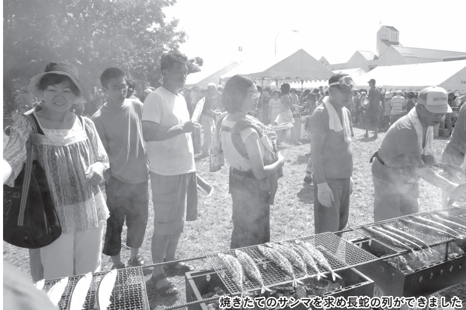
焼きたてのサンマを求め長蛇の列ができました

9月9日、川越市自治会連合会主催の「がんばろう東日本復興応援団 東北秋の味覚まつり」(以下「まつり」)が埼玉川越総合地方卸売市場で開催されました。東北地方の復興支援のために、焼きサンマの無料提供、物産販売のほか各種イベントが行われました。同連合会としてイベントを実施するのは、今回が初めての試み。その舞台裏には多くの人の協力と努力がありました。