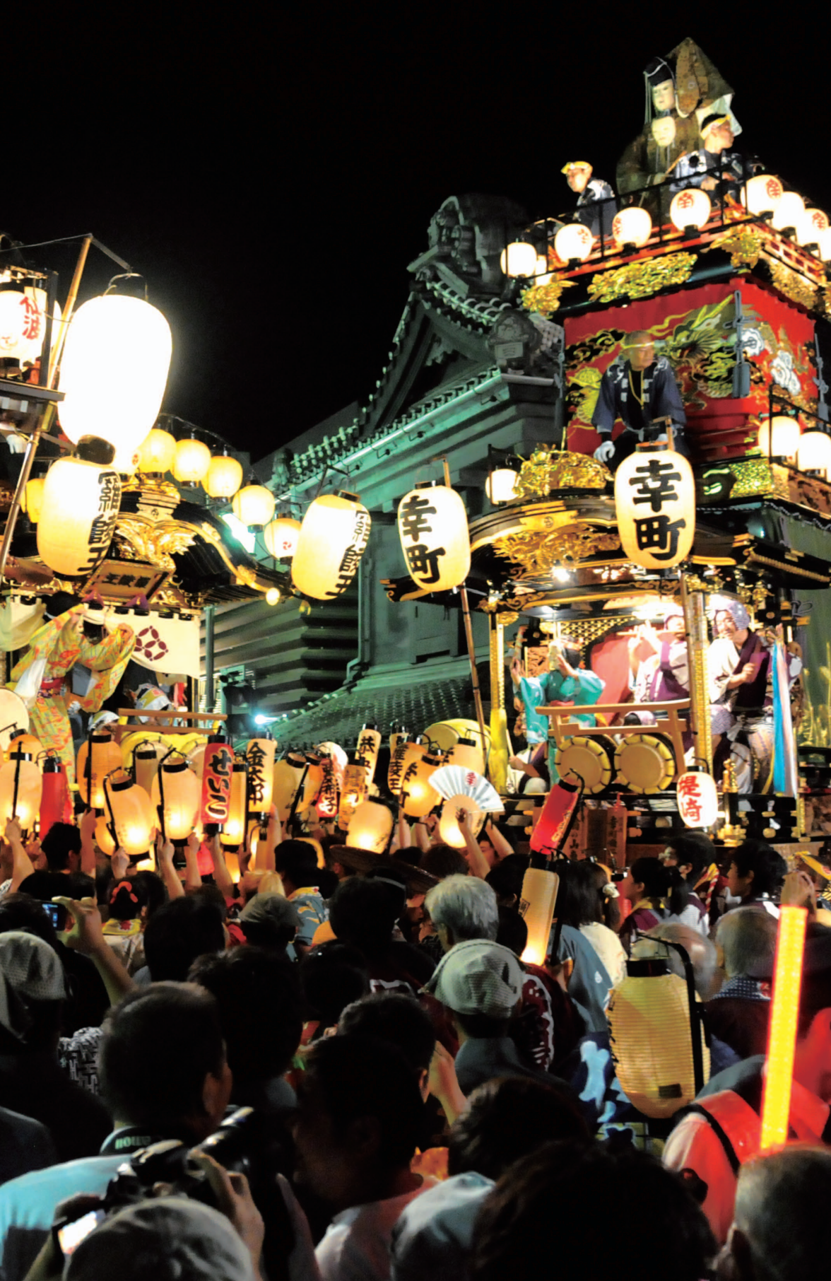
昨年の川越まつり

納め忘れた年金ありませんか：3 「本人通知制度」をご存知ですか：3 川越産業博覧会 時が人を結ぶまち川越 '12さんぱく：4 サンマで復興支援：6