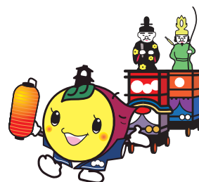
川越市マスコットキャラクター 「ときも」