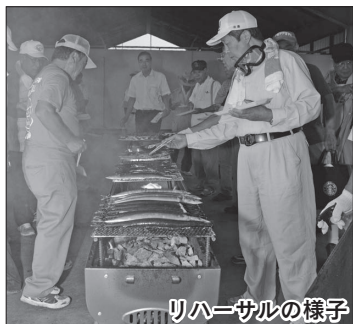
リハーサルの様子