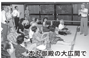
本丸御殿の大広間で

平成16年に横須賀市の大津行政センター市民協働事業として発足した「大津探訪くらぶ」。当初から、幕末期の江戸湾警備の拠点である大津陣屋について調査を始めました。川越藩士やその家族の中には、再び故郷の地を踏むことなく亡く