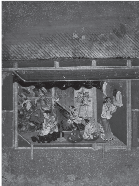
狩野吉信「職人尽絵 糸師」 江戸時代(17世紀) 喜多院蔵 (重要文化財)