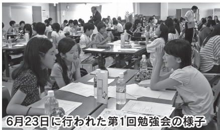
6月23日に行われた第1回勉強会の様子