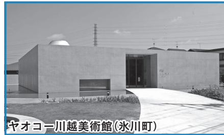
ガオコー川越美術館(氷川町)