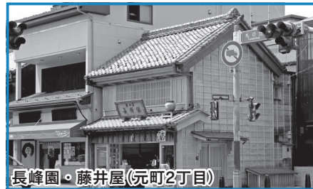
長峰園・藤井屋(元町2丁目)