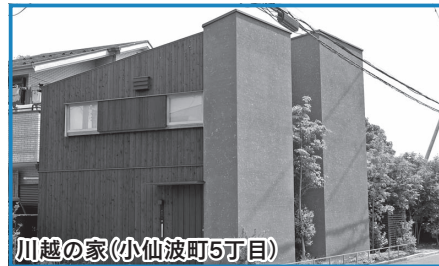
川越の家(小仙波町5丁目)