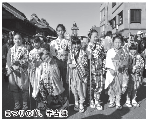
まつりの華、手古舞