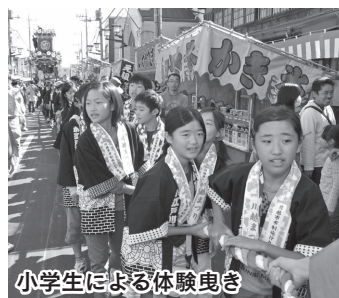
小学生による体験曳き

今年には市制施行90周年を記念して、総勢29台の山車が参加。一番街には例年より多くの山車が並びました(写真上)。沿道では山車が来るのを今か今かと待ちわびる人の姿(写真左)。