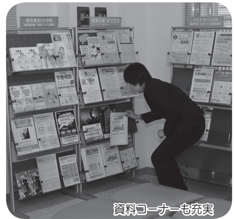
資料コーナーも充実

所在地…郭町1丁目19-6 開館時間…午前9時～午後5時 休館日…土・日曜日、祝・休日、年末年始 * 駐車場はありません。市役所南側駐車場をご利用ください。