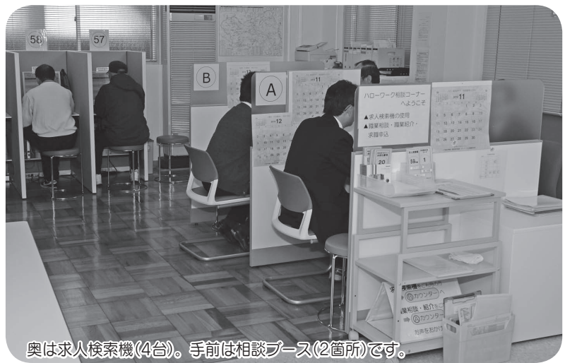
奥は求人検索機(4台)。手前は相談ブース(2箇所)です。