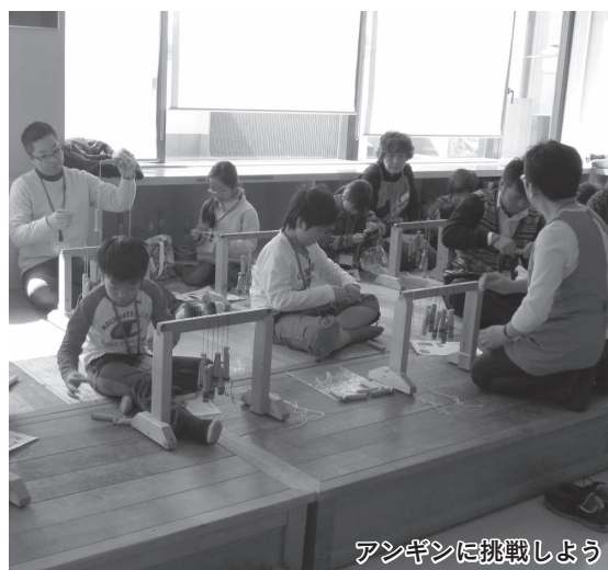
アンギンに挑戦しよう