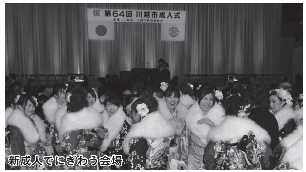
新成人でにぎわう会場