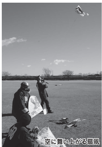
空に舞上がる扇風

つが「川越 扇風」。扇風は、江戸時代末期から昭和20年代まで、川越を中心に普及していた風で、名前のとおり扇の形をしています。当時は、富士見市と川越市にあった風屋で製造され、最盛期には年間2万個以上が販売されていたとのこと。一時廃れてしまいましたが、風愛好家が昭和47年頃から調査し、作り方・技術を復