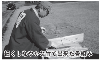
細くしなやかな竹で出来た骨組み

竹と和紙で作る和紙(わが)を中心にした骨組みから作成し、実際に飛ばして伝統の技術を磨く「川越・入間川風の会」。骨組みに適した節の長い竹を求めて自ら取りに行くなど、製作には素材からこだわりを持っていきます。また、風揚げにかけられる情熱も熱く、季節を問わず安比奈親水公園で風を揚げ、日々腕を磨いています。そんな会の自慢のひとつ