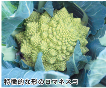
特徴的な形のロマネスコ

食用の部分は花蕾といい、この部分が白色やオレンジ色、紫色などの種類があります。疲労回復に欠かせないビタミンCが豊富で、加熱しても損失が少ないのが特徴です。