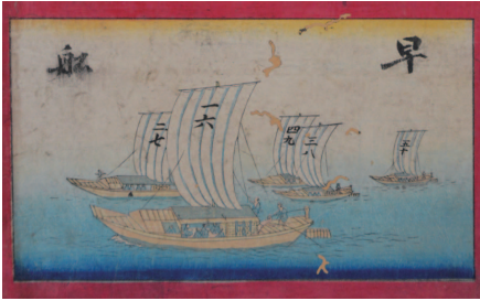
新河岸川早船運賃改正広告(部分・個人蔵)

明治になると仙波河岸が新設され、舟運は重要な交通路として活用されました。しかし、大正3年(1914)に東上鉄道(現在の東武東上線)が開設されると、鉄道が輸送の中心になり、長きにわたった新河岸川舟運はやがて終わりを迎えます。