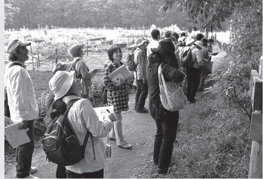
昨年実施した「かわごえエコツアー」