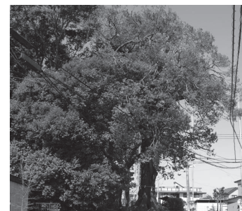
砂氷川神社のシラカシ