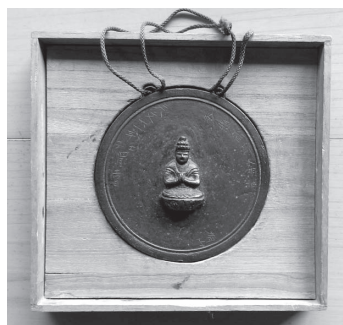
銅造十一面観音懸仏