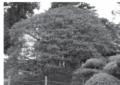
砂氷川神社のイヌツゲ

市政にゆうす 小江戸いんぷお 情報アラカルト 市民相談案内 施設情報 子育て情報館 保健・健康 コラム ひとまち