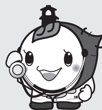
川越市マスコットキャラクター「ときも」 *ときもは埼玉県の「けんこう大使」です。