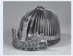
鉄黒漆塗四十八間筋兜鉢

市立博物館・蔵造り資料館・川越城本丸御殿は、川越まつり翌日の10月21日(月)も開館します(各館とも、入館は午後4時30分まで)。