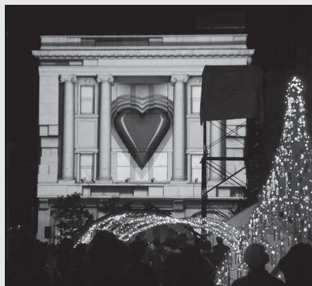
昨年鍛冶町広場で行われたプロジェクションマッピングの様子

* イベントの詳細、期間中の交通規制については10月10日号の広報川越でお知らせします。