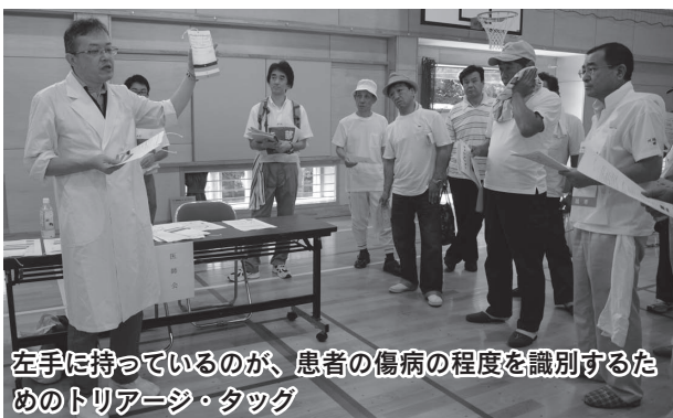
左手に持っているのが、患者の傷病の程度を識別するためのトリアージ・タグ

備蓄品保管室・災害用給水井戸の見学や、医師会によるトリアージの説明、接骨師会によるストレッチ、消防団によるAEDの使い方などが行われました。