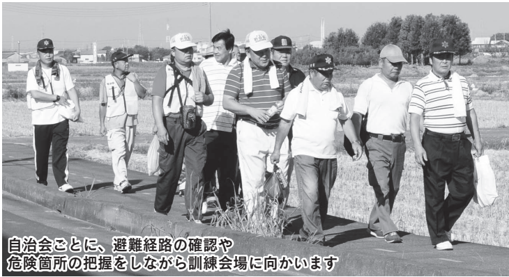
自治会ごとに、避難経路の確認や危険箇所の把握をしながら訓練会場に向かいます