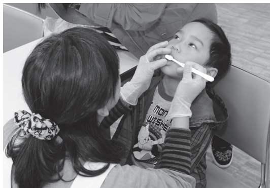
みんないきいき健康まつり