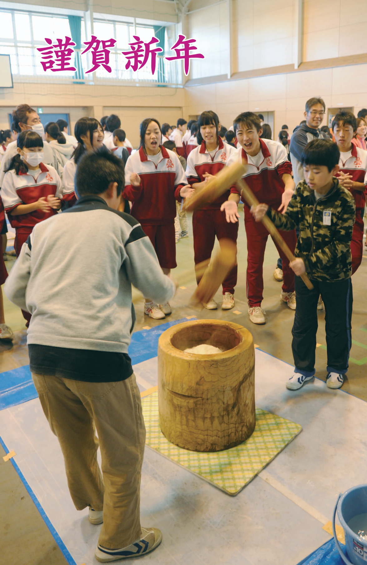
福原中学校で行われた「餅つき大会」。関連記事は裏表紙。

新春を迎えて：2 20歳になったら「国民年金」：4 いくつ知ってる？ 川越の歳時記：6