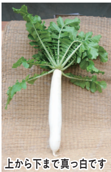
上から下まで真っ白です