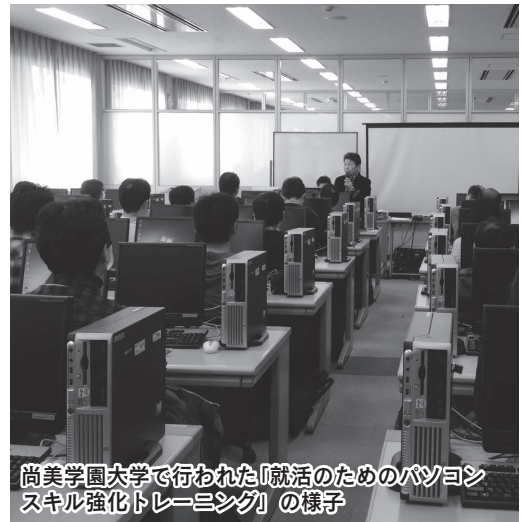
尚美学園大学で行われた「就活のためのパソコンスキル強化トレーニング」の様子

川越しごと支援センターでは、全国のハローワーク求人情報を閲覧できるほかハローワークと同じ職業紹介を受けることができます。また、しごと相談員が就職活動についての悩みや進め方についてアドバイスを行うほか、各種セミナー等も実施しています。