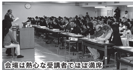
会場は熱心な受講者でほぼ満席