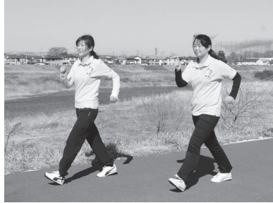
入間川沿いの川越狭山自転車道線(小ヶ谷)

運動を続ける一番のコツは、楽しみながら行うことです。市内には、「歩きたくなる道」がた