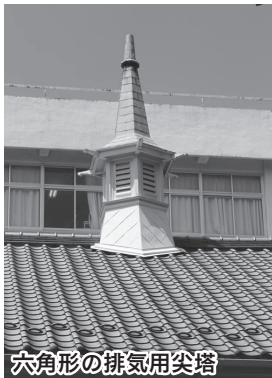
六角形の排気用尖塔

3月25日付で「埼玉県立川越女子高等学校明治記念館」が、新たに市指定文化財(有形文化財・建造物)に指定されました。