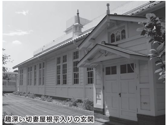
趣深い切妻屋根平入りの玄関

建物内部は、「生きた文化財」として和室は茶道部の部室、洋室は弓道部、マンドリン部の部室や同窓会、PTAの会議室として活用されています。