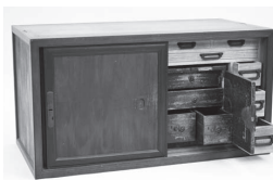
鍵付きの戸があるたんす

時間…午前9時～午後5時(入館は午後4時30分まで) 入館料…200円(160円)▶大学生・高校生100円(80円)▶中学生以下無料 *( )内は、20人以上の団体料金。