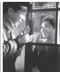
「名もなく貧しく美しく」

会場・問い合わせ…川越スカラ座(元町1丁目 223-0733) 定員…各日先着124人(うち前売り券=各日先着20人) 経費…当日券800円(前売り券=700円) 販売…当日券=上映開始1時間前から、前売り券=10月1日(水)、午前10時から同会場