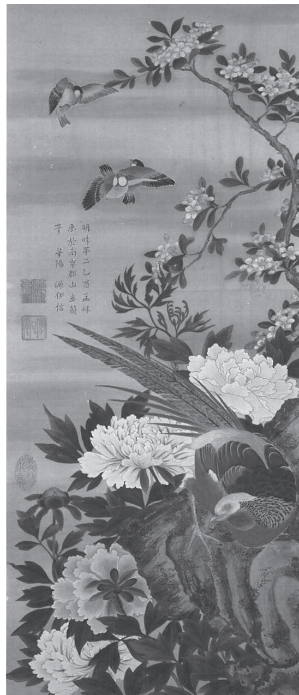
柳澤伊信筆 牡丹錦鶏図 柳沢文庫蔵 美術館展示