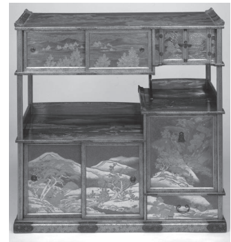
山水時絵書棚(公財)大倉集古館蔵 重要美術品(博物館展示)