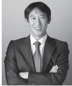
ソウルオリンピック 100m背泳ぎ金メダリスト・鈴木大地さん

(公財)日本水泳連盟会長で、2020年東京オリンピック・パラリンピック競技大会の開催決定に貢献するなど、幅広く活躍されている鈴木大地さんの講演会を開催します。