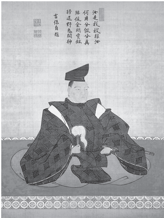
柳澤吉保像 個人蔵 大和郡山市指定文化財 博物館展示

10月18日(土)～12月1日(月)、午前9時～午後5時(休館日を除く。入館は午後4時30分まで)