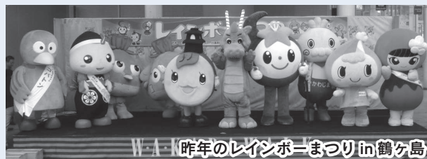
W-A 昨年のレインボーまつり in 鶴ヶ島

川越都市圏まちづくり協議会(レインボー協議会)主催。7市町によるご当地グルメの出店や物販、田園戦士かわじマンショー、キッズダンスなどのステージイベントや、パターゴルフ体験など。当日直接会場。坂戸駅南口・武蔵高萩駅北口から無料送迎バスあり。 日時…10月25日(土)、午前10時15分～午後2時30分(雨天決行) 会場…ベイシアひだかモール店・西側公園(日高市大字森戸新田)