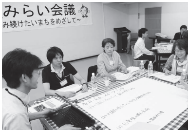
みらい会議 み続けたいまちをめざして