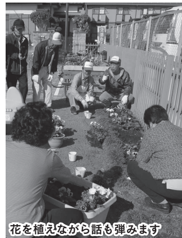
花を植えながら話も弾みます

市民花壇は、地域の住民が手入れをすることを条件に市が指定し、年に2回、花の苗が提供されます。花壇の面積は合わせて約12㎡と決して大きくはありませんが、今年の5月にはポーチユラカをはじめ、6種類の色とりどりの草花を130本植えました。また11月には、「花いっぱい運動」として、自治会の環境衛生推進員が中心となって、公園の日当たりの良い場所とフラワーボックスに130本のパンジーを植えました。