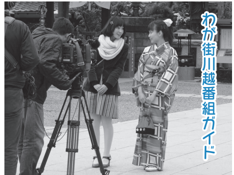
わか街川越番組ガイド

避難誘導訓練の避難者役や負傷者役には、川越市自治会連合会の協力により、225人の市民の皆さんが参加しました。