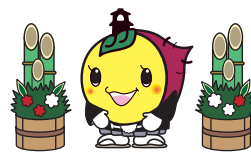
川越市マスコットキャラクター 「ときも」