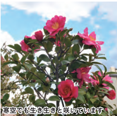
寒空でも生き生きと咲いています

コマツナ、ブロッコリー、ハウレンソウ、ニンジン、ネギ、ハクサイ、サトイモ、イチゴ、菜の花、カブ、ゴボウ、ダイコン、サニーレタス、キャベツ、ミズナ