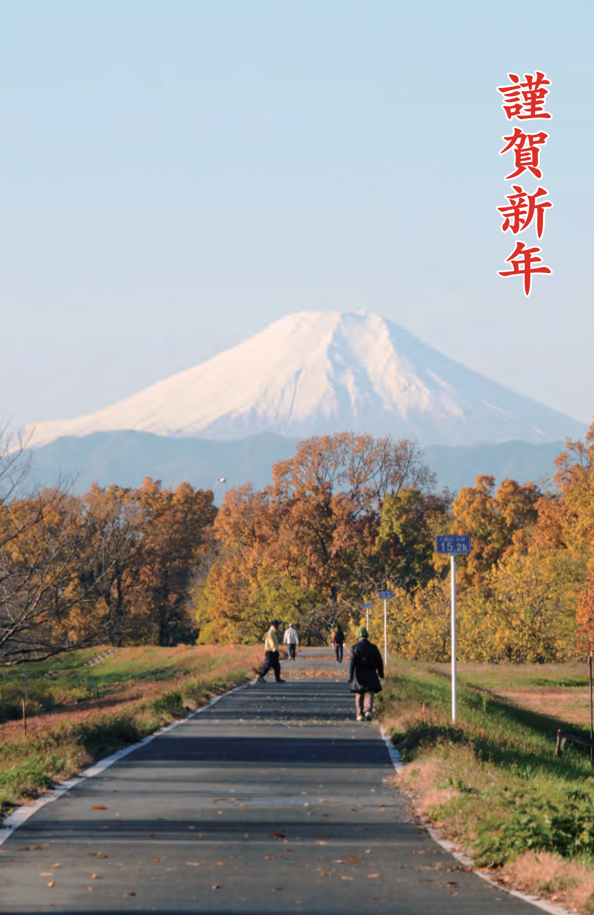
水上公園近くから望む富士山(12月2日撮影)