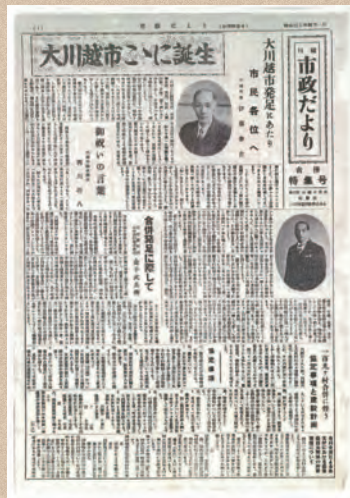
合併特集号(昭和30年4月1日)

「大川越市ここに誕生」と銘打って当時の芳野・古谷・南古谷・高階・福原・大東・山田・名細・霞ヶ関の9か村を合併し、現在の川越市が誕生したことを特集しています。この合併により、人口は10万3千人、面積は約110km 2 となりました。また、4ページには市役所本庁舎・各支所が紹介されています。