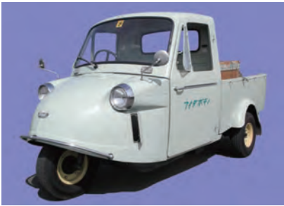
オート三輪ダイハツミゼット MP5 (昭和39年製造)