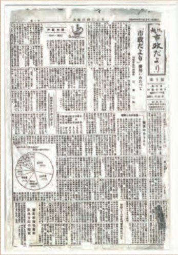
創刊号(昭和26年4月20日)

創刊号は「川越市政だより」として発行されました。「市政だより」発刊にあたってと題し、市長代理助役が「言うまでもなく市役所は市民皆さんのための市役所であり、市政は市民皆さんのための市政であります」と述べています。 発行は月1回。市内全世帯へ配布し、大きさはタブロイド判で両面刷りでした。