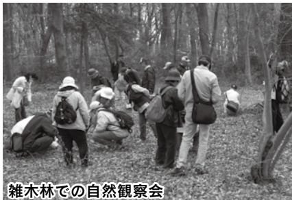
雑木林での自然観察会

皆さんは「生物多様性」という言葉をご存じですか。生物多様性とは、地球上には多種多様な生き物がいて、それぞれが個性を持ち、互いにつながり支え合いながら生きている、ということ。私たちは、生物多様性が保たれていることで、さまざまな恩恵を受けています。何か欠けてそれが壊れてしまうと、生き物は生きていけなくなってしまう。