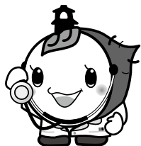
ときもは埼玉県の「けんこう大使」です

特定健診とがん検診を合わせて受けることができます。詳しくは、受診券に同封の案内をご確認ください。