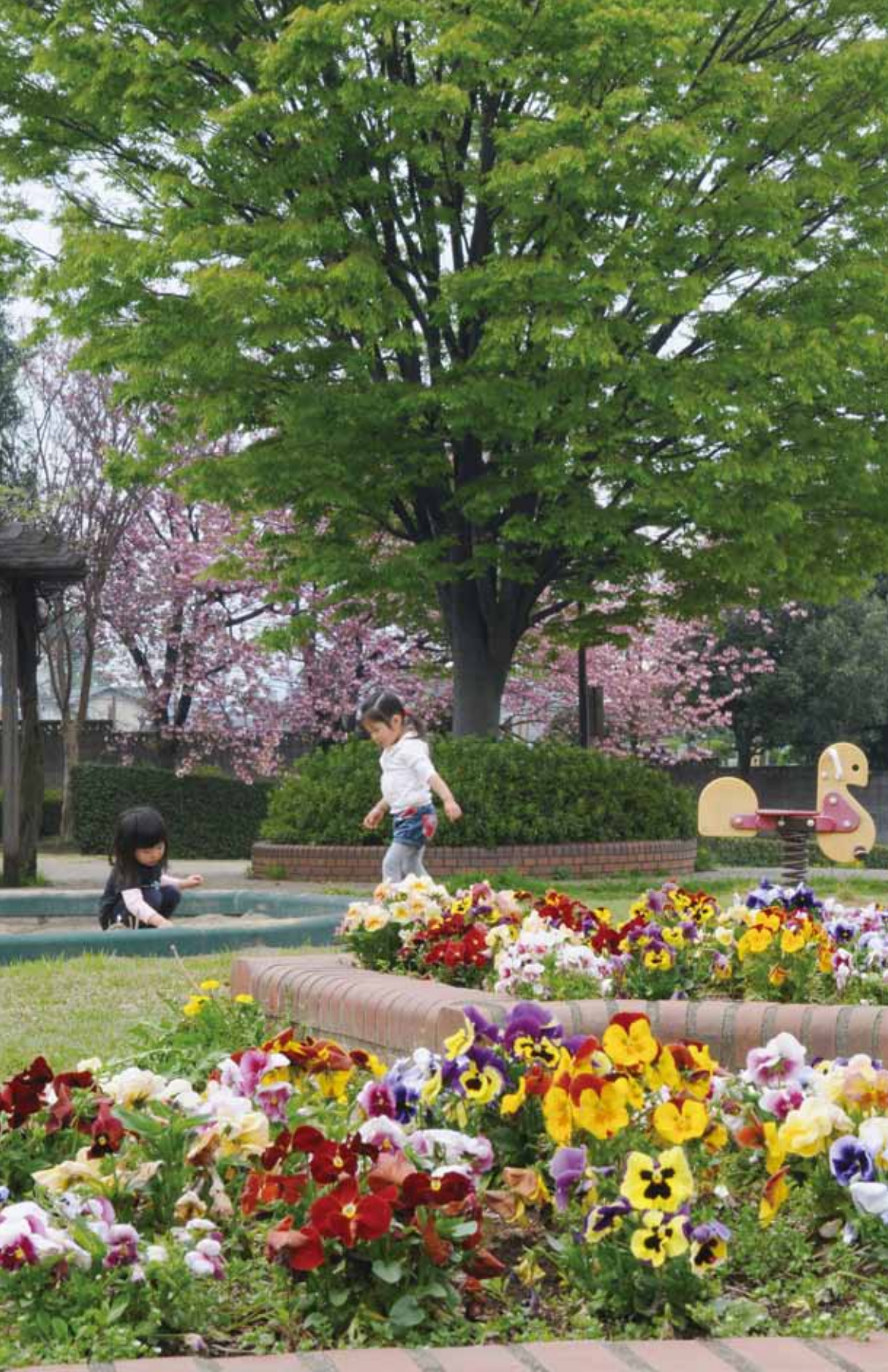
濯紫公園(喜多町・4月17日撮影)

川越市議会議員一般選挙の結果：3 平成27年度は固定資産税「評価替え」の年です：6