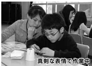
真剣な表情で作業中

霞ヶ関公民館で3月31日に親子理科工作教室が行われました。鉛筆の芯を使って電子楽器を作り、電気の流れを学ぶことが目的。