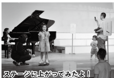
ステージに上がってみたよ!