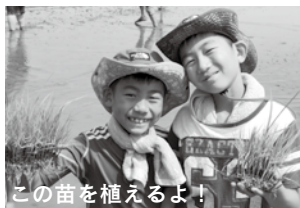
この苗を植えるよ!

5月31日に農業ふれあいセンターが実施した「田植え体験」には38家族が参加。手にした苗を数本ずつ、