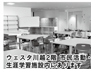
ウェスタ川越2階 市民活動・生涯学習施設内にあります

*このほかウェスタ川越では、市民活動支援講座を実施しています。ぜひ、ご利用ください。