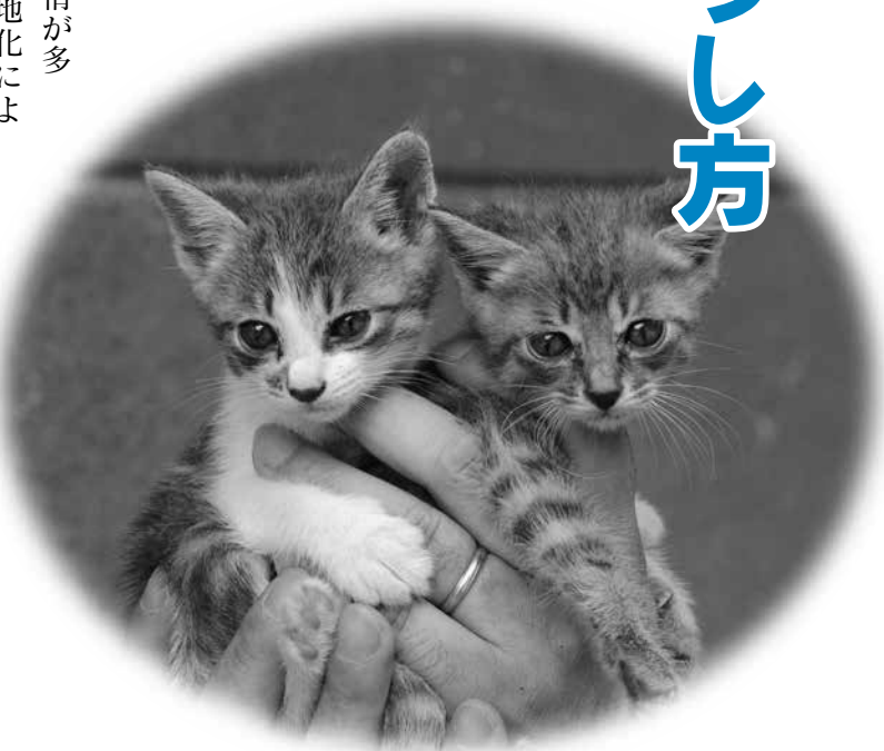
■市内における猫の苦情・相談件数 (単位：件)

「猫は自由奔放な生き物。気ままに外に出かけ、塀の上を優雅に歩いて、縁側でのんびり日なたぼっこ」そんな姿を思い描いていませんか？しかし、都市化が進み、宅地が密