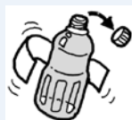
キャップ・ラベルを外す

ペットボトルは清掃センターで圧縮処理を行いますが、キャップが付いたままだと中の空気が抜けず、作業に支障が生じてしまいます。スムーズなリサイクルのため、皆様のご協力をお願いします。