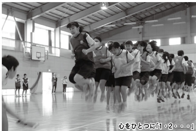
心をひとつに「1・2・・・」

オリンピックアンソングプロジェクト 10月20日、霞ヶ関西中学校の2年生を対象に「オリンピックピック教室」が開催されました。オリンピック出場経験アスリート（オリンピック2人）を招き、オリンピック自身のさまざまな経験を通して「オリンピックの価値や精神」を伝えることを目的として（公財）日本オリンピック委員会が企画。 授業は運動と座学が行われ、運動の授業では、縄跳びやソフтбоールを使い、「自分たちで考え行動すること」や「あきらめない心」を学びました。クラス全員でチャレ