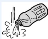
中身を捨てて、軽く水洗い