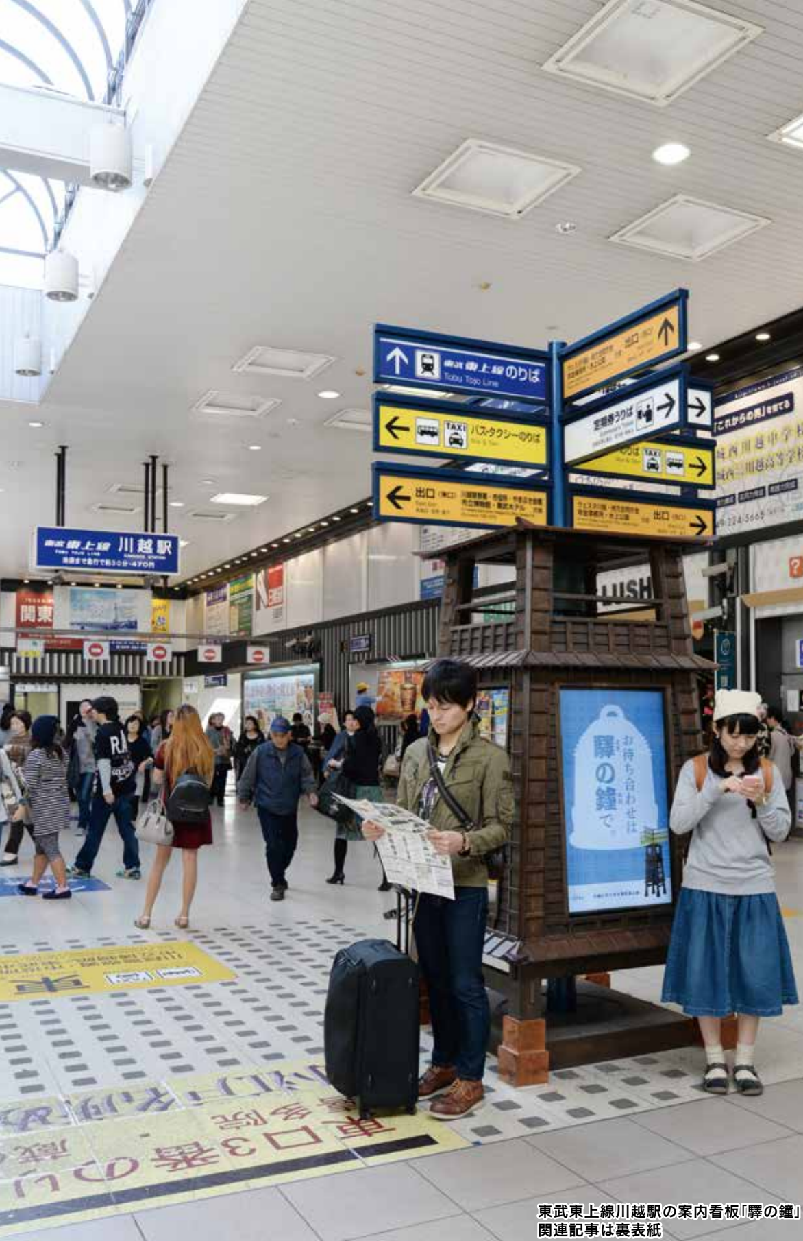
東武東上線川越駅の案内看板「駅の鐘」 関連記事は裏表紙