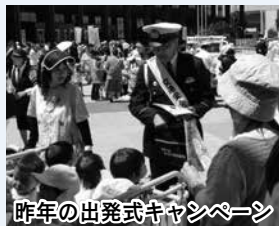
昨年の出発式キャンペーン

4月6日(水)～15日(金)に、春の全国交通安全運動を実施します。市では関係機関・団体と協力し、次のとおりキャンペーンを行います。