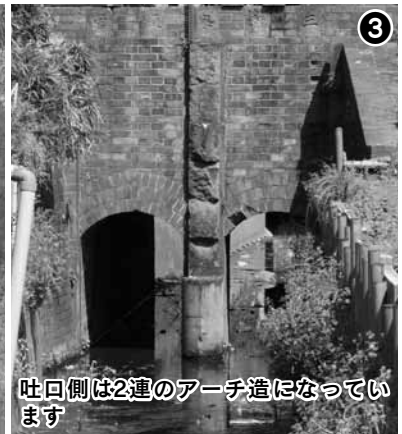
吐口側は2連のアーチ造になっています