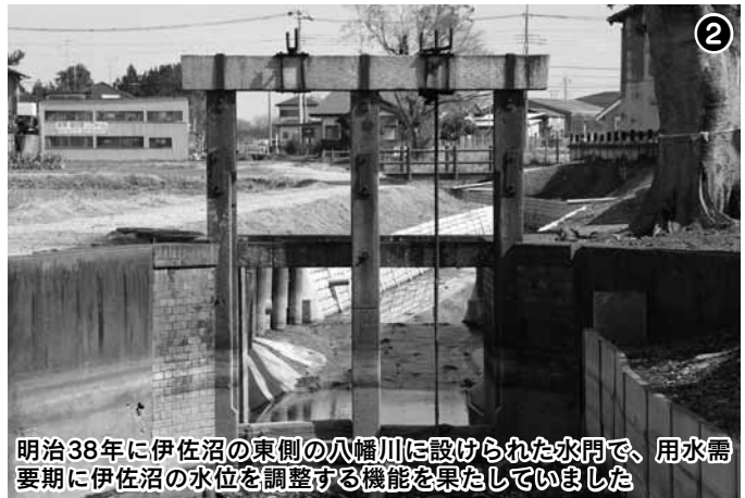
明治38年に伊佐沼の東側の八幡川に設けられた水門で、用水需要時に伊佐沼の水位を調整する機能を果たしていました