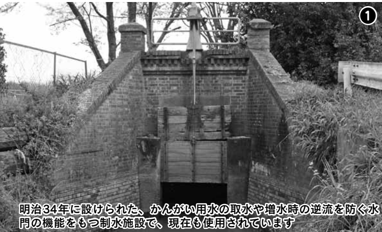
明治34年に設けられた、かんがい用水の取水や増水時の逆流を防ぐ水門の機能をもつ制水施設で、現在も使用されています