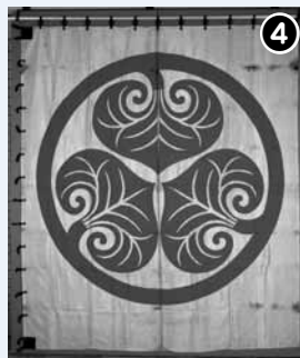
白地に「丸に三葉葵紋」が朱で描かれています

有形文化財歴史資料に指定された④松井松平家伝来葵紋大旗 附 大旗地裂 並 縫系3点3旒(右写真=複製のうちの1旒)は、松平周防守家菩提寺の光西寺に伝わる幅257cm、縦226cmの葵の御紋の旗です。『松平家譜』等に記録がある、天正10年(1582)に徳川家康から松井松平家初代康親が賜った葵御紋大旗1旒と、その後江戸時代に作られた複製2旒であると考えられます。