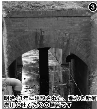
明治43年に建設された、悪水を新河岸川に吐くための樋管です