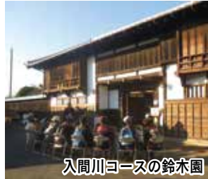
入間川コースの鈴木園