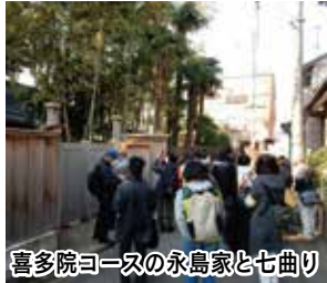
喜多院コースの永島家と七曲り

「川越百景」とは、市内に点在する優れた景観を、平成24年度に公募し選定したものです。この川越百景の啓発と、観光資源としての活用調査を目的として、同27年度に「新河岸川舟運でたどる川越の歴史」「入間川ウオークと中世河越めぐり」「喜多院界隈と四門めぐり」の3つのテーマでモニターツアーを実施しました。それぞれのツアーでは、点在している川越百景を線で結び、歩きながら巡りました。こうすることで、大きな歴史の流れを感じることが出来ます。 モニターツアーの調査結果等をもとに、都市景観課では市内全10コースのウォーキングマップを作成し、同課(本庁舎5階)で無料配布しています。川越の歴史や文化、自然にふれるだけでなく、ウォーキングの楽しみも感じられる川越百景めぐり。みなさんもお気に入りの景観を探しに出掛けてみてはいかがでしょうか。