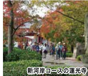
新河岸コースの蓮光寺