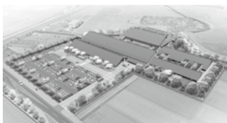
新斎場(完成イメージ)

未然防止に関する取り組みを行います。また、新斎場を整備し、供用開始後は効率的な運営を図ります。