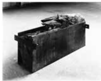
《水量 - 鉄・桜》

日時…7月23日(土)～9月11日(日)、午前9時～午後5時(入館は午後4時30分まで) 入館料…500円(400円)▶大学生・高校生250円(200円)▶中学生以下無料▶障害者手帳所持者と付添者無料 * ( )内は20人以上の団体料金。