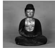
木造阿弥陀如来坐像 中福阿弥陀堂

日時…7月16日(土)～8月28日(日)、午前9時～午後5時(入館は午後4時30分まで) 入館料…200円(160円)▶大学生・高校生100円(80円)▶中学生以下無料 * ( )内は20人以上の団体料金。