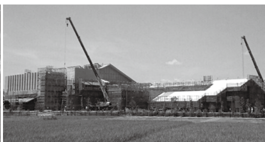
建設が進む仮称川越市新斎場(左：上から/右：東側から。平成28年7月中旬撮影)