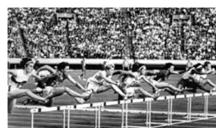
「東京オリンピック」

会場・問い合わせ…川越スカラ座(元町1丁目 ☎223-0733) 定員…各先着124人 経費…各500円(上映開始1時間前から販売)