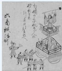
氷川祭礼絵巻 (部分・川越氷川神社蔵)