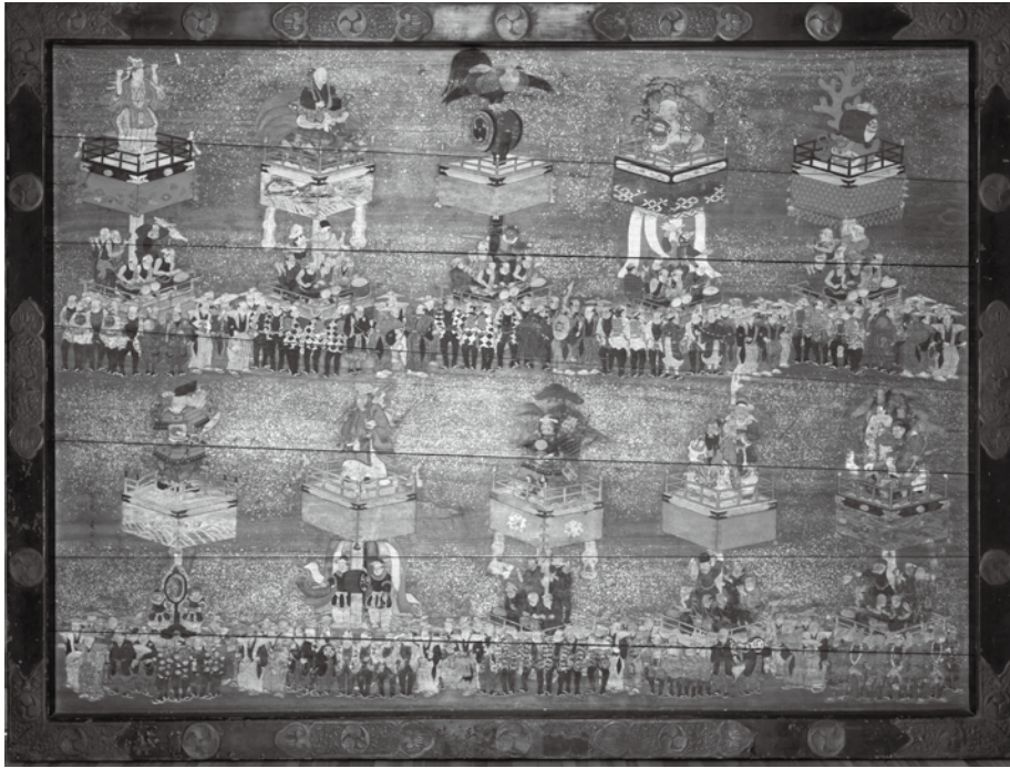
氷川祭礼絵馬(川越氷川神社蔵)

10月8日(土)～11月23日(祝)、午前9時～午後5時(休館日を除く。入館は午後4時30分まで)