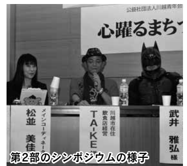
第2部のシンポジウムの様子

また当日行われた肉の祭典では、市内の飲食店15店が出店し、ハンバーガーやスペアリブ等さまざまな肉料理が販売されました。あいにくの天気の中、多くの家族連れが、ここでしか味わえない料理をおいしそうに食べていました。