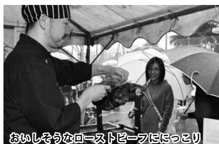
おもしろな肉=ストビーフにっこり