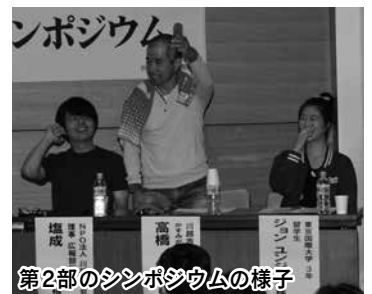
第2部のシンポジウムの様子