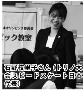
石野枝里子さん(トリノ大会スピードスケート日本代表)

オリンピック出場経験アスリート(オリンピック)が先生となり、「オリンピックの価値や精神」を伝えることを目的とした「JOC オリンピック教室」が、9月20日に霞ヶ