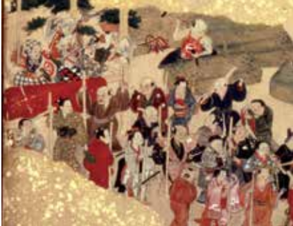
川越の四季屏風(各部分・個人蔵)