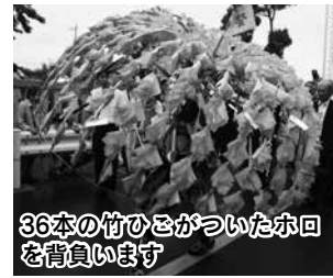
36本の竹ひこがついたホロを背負います

9月18日に、古尾谷八幡神社で県指定無形民俗文化財のほろ祭が行われました。ホロを背負うのは地域の小学生の男の子4人。ホロ