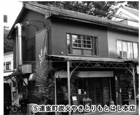
⑤連雀町炭火やきとりもとはし本店