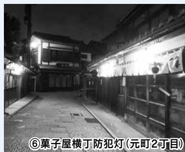
⑥菓子屋横丁防犯灯(元町2丁目)

景観をつくり出すさまざまな具象的・抽象的要素(ポイント)についての模範となるもの。