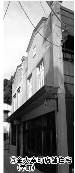
③金大幸町店舗住宅(幸町)