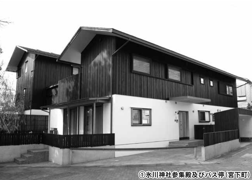
①氷川神社参集殿及びバス停(宮下町)