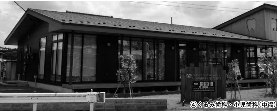
④くるみ歯科・小児歯科(中福)