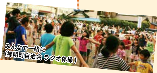
みんなと一緒に (神明町自治会 ラジオ体操)