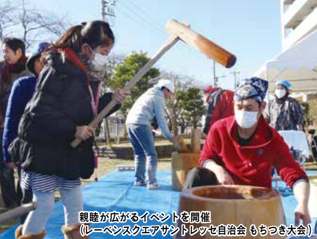
親睦が広がるイベントを開催 (レーベンスクエアサントレッセ自治会 もちつき大会)