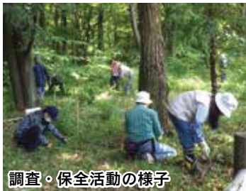
調査・保全活動の様子

同団体は、本市の望ましい環境像を実現するために設立された、市民、事業者、民間団体および市のパートナーシップ組織です。個人と団体(事業者・民間団体・川越市)の会員が参加し、自然環境保全や、まち美化活動等、さまざまな魅力あふれる活動を行っています。今回受賞した(仮称)川越市森林公園計画地での活動