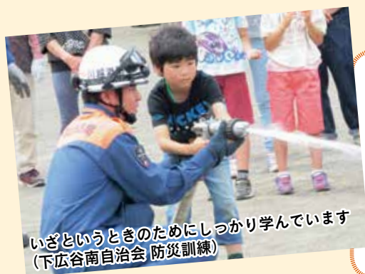
いざという時のためにしっかり学んでいます (下広谷南自治会 防災訓練)