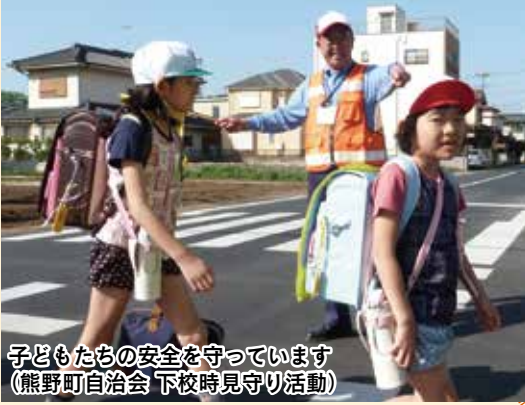
子どもたちの安全を守っています (熊野町自治会 下校時見守り活動)