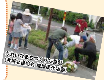
きれいなまちづくりに貢献 (今福北自治会 地域美化活動)

春と秋の年2回開催される、市のクリーン川越市民運動(ごみゼロ運動)に参加するなど、道路や地域の環境美化活動に取り組んでいます。このような活動が、きれいで快適なまちづくりにつながっています。