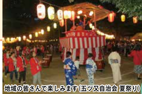
地域の皆さんで楽しみます(五ツ又自治会 夏祭り)

地域の交流と親睦を目的に、夏祭りや運動会など気軽に参加できる行事を開催しています。日ごろから顔を合わせることで地域の連帯感が強まり、「助け合い」の気持ちが生まれます。また、子どもたちの健全な育成、レクリエーションや老人クラブの振興などを行い、住みよいまちづくりに貢献しています。