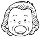
①「あー」と口を大きく開く

健口体操の一つ「あいうべ体操」を行って、口の機能をアップしましょう。口を大きく、ゆっくり、はっきり動かすことがポイントです。