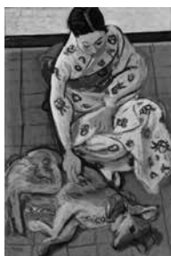
安井曾太郎「女と犬」