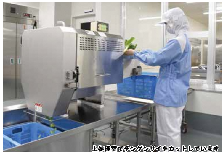
上処理室でチンゲンサイをカットしています