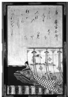
三十六歌仙額 齋宮女御 仙波東照宮蔵 重要文化財

日時：10月22日～11月12日、日曜日ほか(全4回)、午後1時30分～3時30分 対象：20歳以上 定員：先着80人 申し込み：10月5日(木)午前9時から電話・ファクスで同館