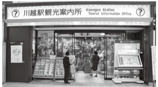
リニューアルした川越駅観光案内所