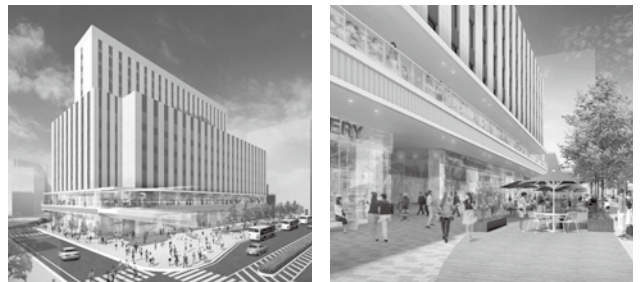
川越駅西口市有地利活用(完成イメージ)