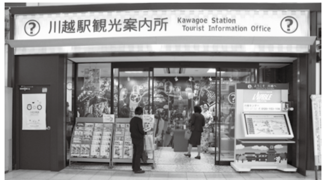
リニューアルした川越駅観光案内所