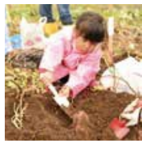
表 紙の写真はサツマイモ収穫体験の様子。子どもたちが泥まみりになりながら、スコップを片手に一生懸命に掘り進んでいました。自分の顔ほどある大きなサツマイモを持ち上げ、目をキラキラさせている姿は、少し誇らしげでした。家に帰り、子どもたちが食欲の秋を満喫している様子が目に浮かびます。

命芋掘りをしていました。自分の顔ほどある大きなサツマイモを持ち上げ、目をキラキラさせている姿は、少し誇らしげでした。家に帰り、子どもたちが食欲の秋を満喫している様子が目に浮かびます。