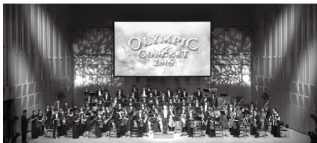
オリンピックコンサート2016 in 川越