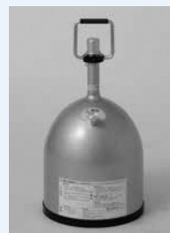
〈大賞〉-196℃の液体窒素を安全で手軽に扱えるようにした高性能魔法瓶

●圧縮空気の不純物質を取り除く装置「デューパワードライヤー」=パワードライヤー(株)