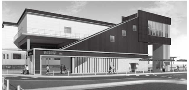
新河岸駅東口(完成イメージ)