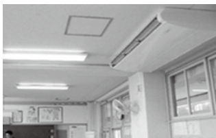
小学校の空調設備