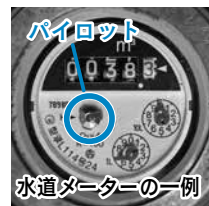
パイロット 水道メーターの一例

写真)が動いていれば、水道メーターから蛇口までのどこかで漏水している可能性があります。