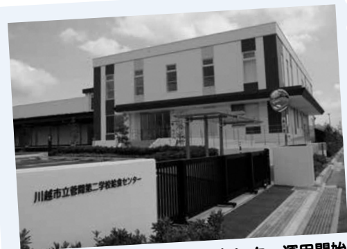
H29.9.1 菅間第二学校給食センター運用開始