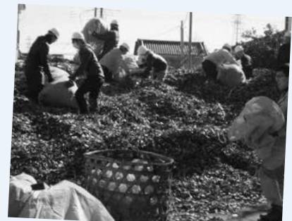
H29.3.14 「武蔵野の落ち葉堆肥農法」日本農業遺産に認定