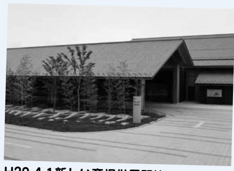
H29.4.1新しい斎場供用開始