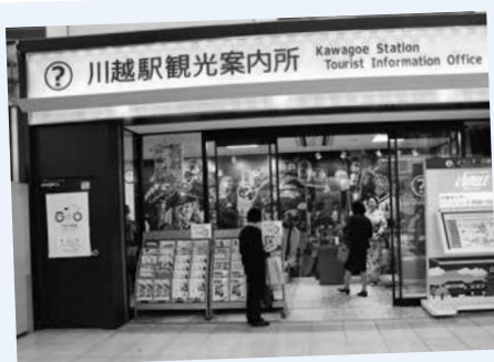
H29.3.18川越駅観光案内所リニューアル