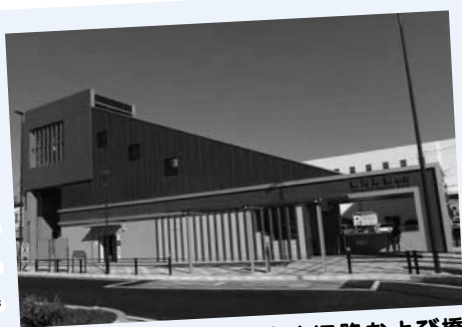
H29.12.3新河岸駅の自由通路および橋上駅舎、西口駅前広場が完成。東口を新設