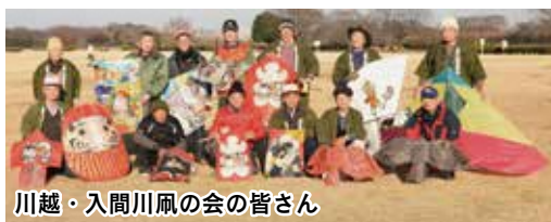
川越・入間川凧の会の皆さん

た。チームの一員として参加。デンマークの空に、川越の「だるま凧」などを揚げ、川越をうきつけを作りました。