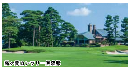
霞ヶ関カントリー倶楽部

結びに、市民の皆様のご健勝と ご多幸を祈念申し上げ、新年のご あいさつといたします。